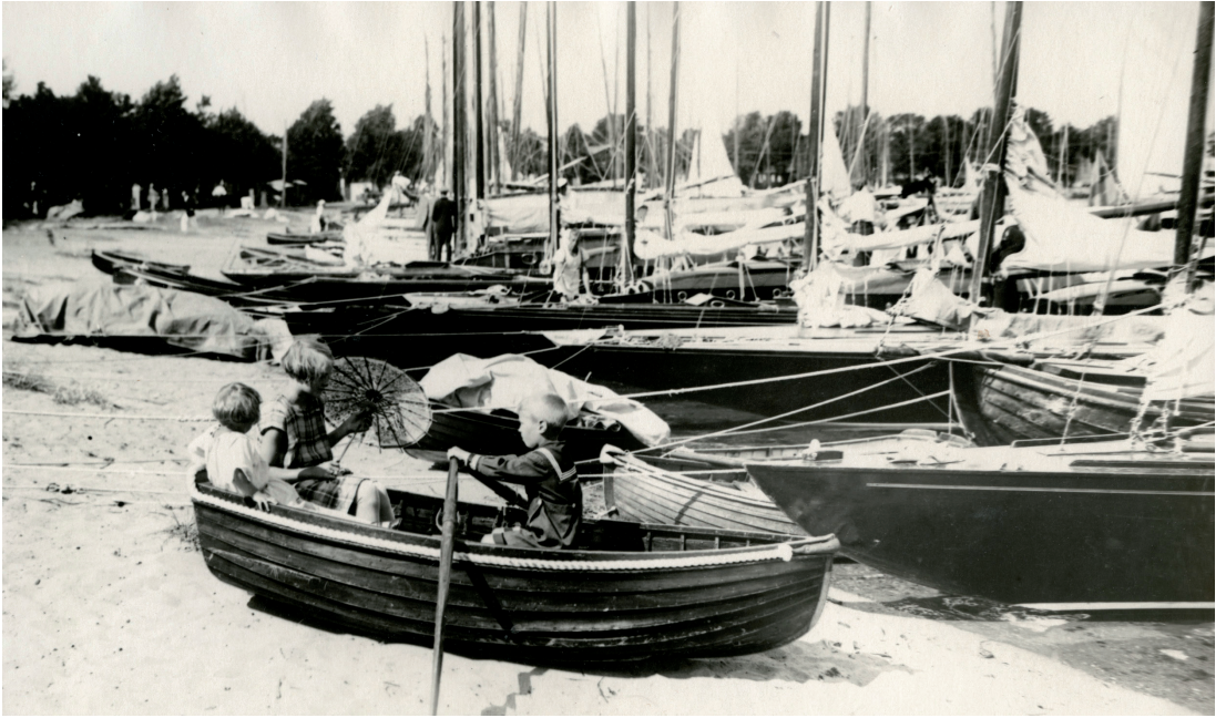
Den legendariska sandstranden i Sandhamn.