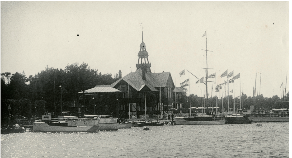
KSSS klubbhus i Sandhamn